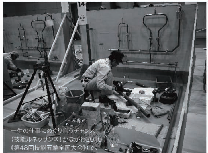
一生の仕事にめぐり合うチャンス！ （技能ルネッサンス！かながわ2010 《第48回技能五輪全国大会》で。）